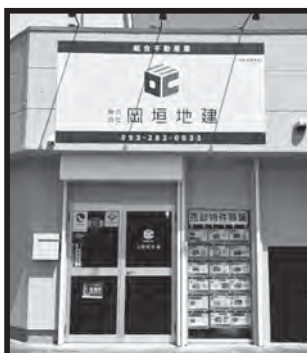
海老津バスのりば横