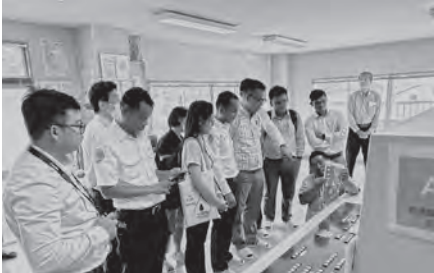
▲浄水場見学の様子

毎年6月1日から7日までは水道週間です。蛇口をひねればいつでも使える水道水。私たちの家庭に届くまでには、水道水の安全管理や水道管などの維持・修繕にたくさんの人が関わっています。この機会に、水道の大切さについて理解を深めてみませんか。