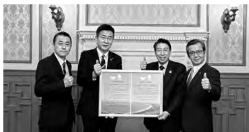
▲3月28日、本町の宣言と岡垣町議会での決議を服部誠太郎福岡県知事に報告しました。(写真左から、森山議長、門司町長、服部県知事、松本県議会議員)