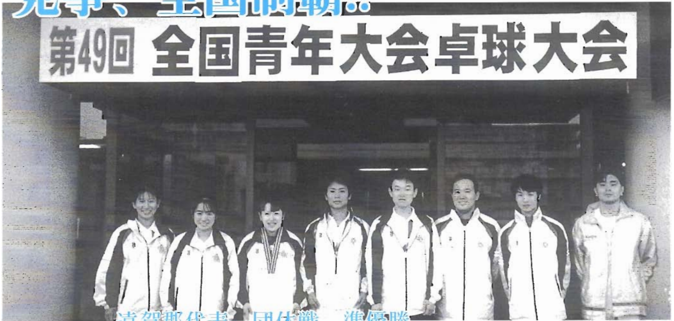
遠賀郡代表 団体戦 準優勝